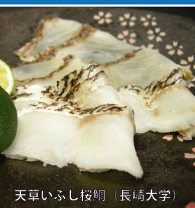
天草いふし桜鯛 (長崎大学)