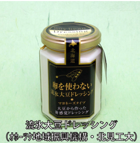
流氷大豆ドレッシング (おろろ地域振興機構・北見工大)