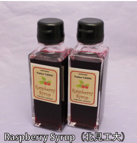
Raspberry Syrup (北見工大)