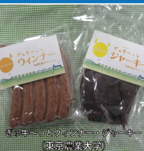
きの牛べつとウインナー・ジャッキー (東京農業大学)