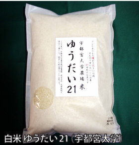
白米 ゆうたい21 (宇都宮大学)