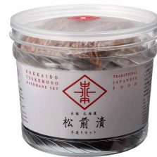
松前漬 (北海道大学)