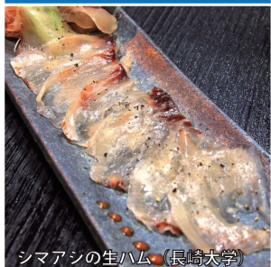
シマアンの生ハム (長崎大学)