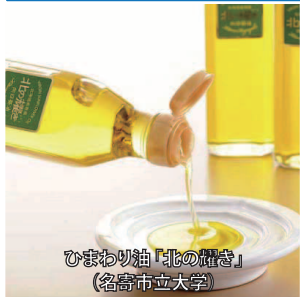
ひまわり油「北の輝き」 (名寄市立大学)