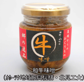
和牛味噌 (おろろ地域振興機構・北見工大)