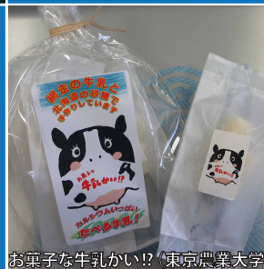
お菓子な牛乳かい!? (東京農業大学)