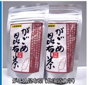
がごめ昆布茶 (北海道大学)